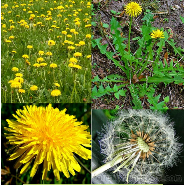
Taraxacum officinale (ljekoviti maslačak)