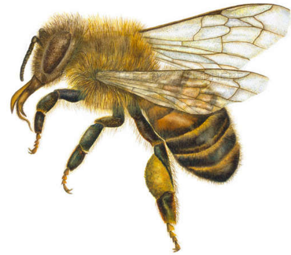
Apis mellifera (pčela medonosna)