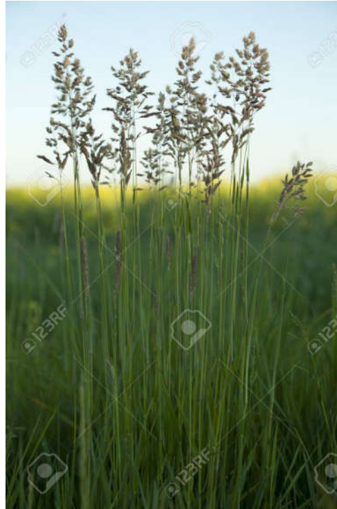
Poa pratensis (livadarka)