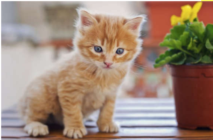
Felix domestica (domaća mačka)